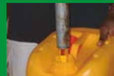
Table ronde 8 : L'indépendance énergétique des pays africains passe-t-elle par les biocarburants ?

Table ronde 7 : Proposer des Relations de partenariat entre le public et le privé