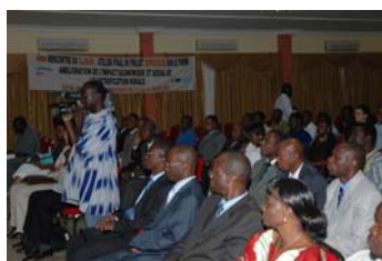
Séance d'ouverture de l'atelier

Cette coordination multisectorielle, tout comme le recours aux Systèmes d'Information Géographique (SIG), furent des éléments clés du succès d'IMPROVES-RE.