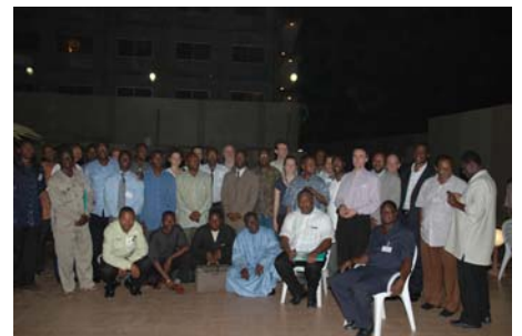
Participants de l'atelier